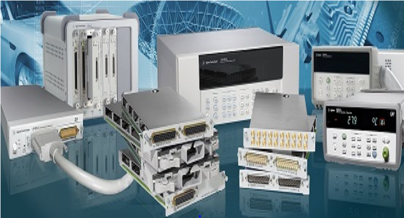
DCI DCI, DCIOLA, VERİ TOPLAMA VE KONTROL KARTLARI