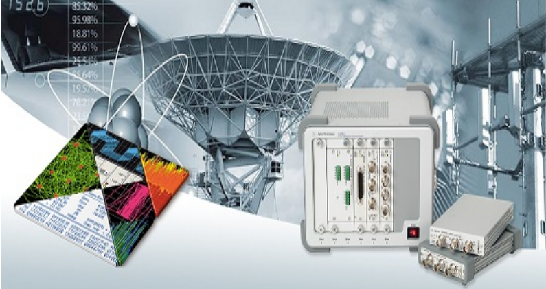
GPIB & RS232/485 ARAYÜZLÜ VERİ TOPLAMA ve KONTROL SİSTEMLERİ