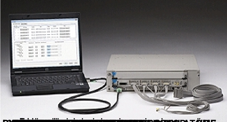
PC ÜZERİNDEN VERİ TOPLAMA VE KONTROL SİSTEMLERİ