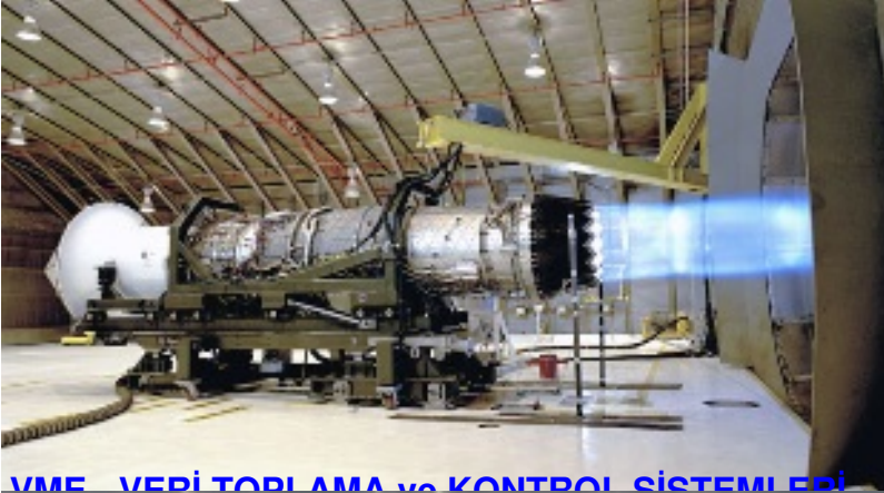
VME VERİ TOPLAMA ve KONTROL SİSTEMLERİ